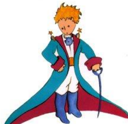
Aquí tienen el mejor retrato que más tarde logré hacer de él

Me puse en pie de un salto como herido por el rayo. Me froté los ojos. Miré a mi alrededor. Vi a un extraordinario muchachito que me miraba gravemente. Ahí tienen el mejor retrato que más tarde logré hacer de él, aunque mi dibujo, ciertamente es menos encantador que el modelo. Pero no es mía la culpa. Las personas mayores me desanimaron de mi carrera de pintor a la edad de seis años y no había aprendido a dibujar otra cosa que boas cerradas y boas abiertas.